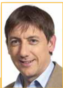
Jan Jambon Kamerlid

Als er iets duidelijk is na maanden onderhandelen, dan is het wel dat België vierkant draait.